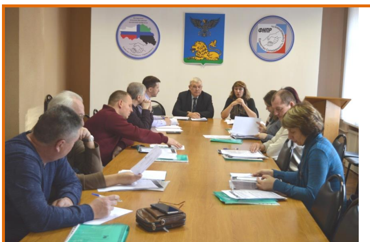
Обучение профсоюзного актива на тему «Новое в трудовом законодательстве РФ».